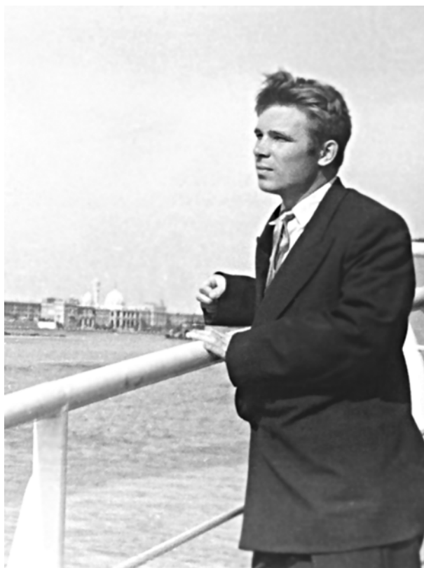
Рис. 2. Б.А. Тареев на борту НИС «Академик Курчатов». 1969 г.

С первого взгляда кому-то может показаться, что ничего особо парадоксального в Третьем Парадоксе Тареева не обнаруживается. Но, тем не менее, это так: ведь для многих современных и пока молодых океанологов, особенно для тех, кто ещё не удосужился познакомиться со всеми деталями развития своей науки в XX веке, личность учёного, о котором повествуется в настоящей статье, парадоксально ассоциируется исключительно с названным его именем известным глобальным океанским течением. Однако этой ассоциацией всё, что связано с этим замечательным человеком, не ограничивается. Для всех, кто его знал или когда-нибудь о нём услышит, либо встретится на страницах научных изданий, это название навсегда «принадлежащего» ему течения в океане, в первую очередь, будет свидетельством того, что имя Бориса Александровича Тареева, нашего давнего друга и коллеги по жизни и по работе, по достоинству оценено и занесено навечно в книгу истории его любимой науки – океанологии.