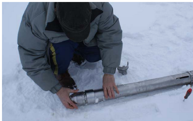
Рис. 3. Подготовка трубки-бура к отбору проб донных осадков в период ледостава.

Собранная трубка-бур выводится за борт плавсредства, или в подготовленную полынь в зимних условиях (рис. 3). Предварительно, чтобы исключить потерю, к нижней секции штанги рекомендуется прикрепить фал с помощью разборного кольца или скобы с возможностью вращения штанги внутри этой детали. Для этого на нижней секции полезно иметь стопорное кольцо, под которым крепится фал. Удерживая нагрузку на фале, а штангу в вертикальном положении, трубка опускается в воду. По мере опускания производится наращивание секций штанги, а чтобы при этом уменьшить нагрузку и исключить изгиб штанги, к секциям через определенные интервалы можно присоединять дополнительные элементы, которые обеспечат плавучесть, например – куктыли, используемые на рыболовных судах. В этом случае для всей сборки обеспечивается небольшая отрицательная пла-