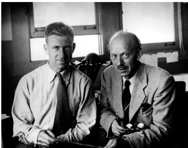
В. Манк и его научный руководитель Х. Свердруп в конце 1930-х годов.

Вальтер Манк (Walter Munk) – один из наиболее известных океанологов нашего времени – недавно отпраздновал свое 100-летие. Он родился в Австрии 19 октября 1917 г. В возрасте 14 лет семья переехала в Нью-Йорк. Его родители готовили сыну карьеру банкира, чтобы продолжать семейный бизнес. Через некоторое время семья переехала в Калифорнию.