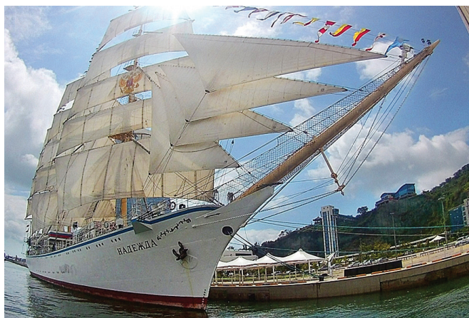
Фото 6. Парусник «Надежда»

Его любовь к морю, парусному спорту и Интернет-технологиям однажды привели его к осуществлению мечты. В 2004 г. он принял участие в экспедиции парусного учебного судна «Надежда», где были проведены успешные испытания его разработки – спутниковой передачи данных в реальном времени – фото 6.