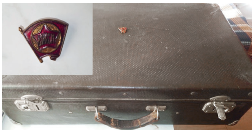
Рис. 6 – Легендарный чемодан и крупным планом на врезке комсомольский значок Ю. И. Визбора.