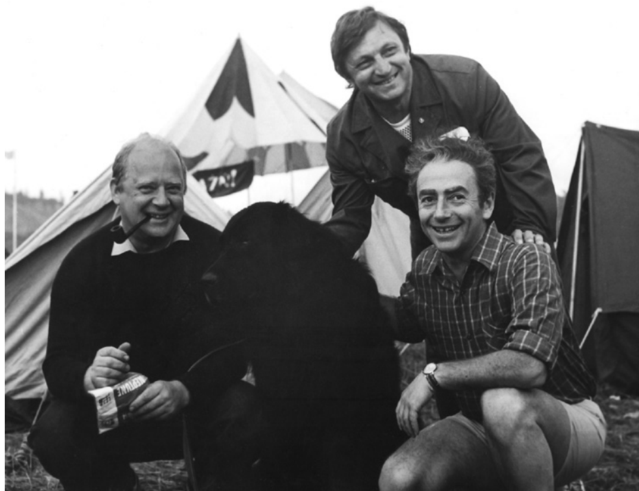
Рис. 1 – Слева направо: Юрий Визбор, Виктор Берковский и Александр Городницкий на Грушинском фестивале, 1976 г.

По их воспоминаниям, Юрий Иосифович во время своего выступления много шутил, выглядел хорошо. А вечером дома, в своем дневнике 9 февраля Ю. Визбор записал: «Плохо себя чувствовал. Ехать не хотел, но поехал. На сцене было холодно, дуло в голову».